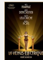
LA VÉNUS ÉLECTRIQUE