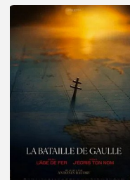
LA BATAILLE DE GAULLE (L'ÂGE DE FER)